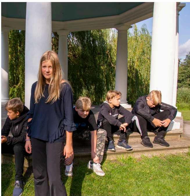
Den proaktive indsats

VIGTIGT er det at fastholde, at unge, som begår kriminelle handlinger, ikke er kriminelle – betegnelsen er stigmatiserende.