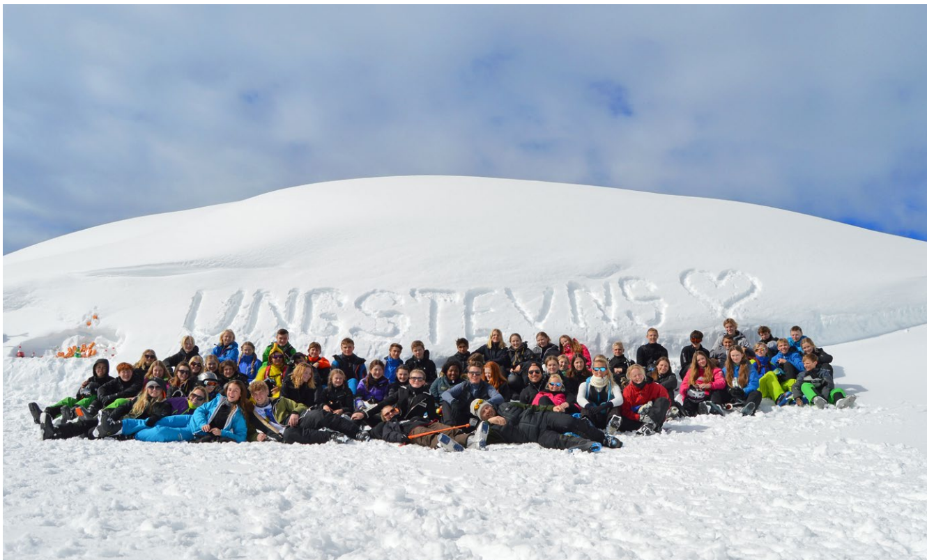
Ungdomsskolens skitur er et eksempel på en relations-opbyggende aktivitet

Formålet med SSP-samarbejdet er at forebygge kriminalitet og misbrug blandt unge.