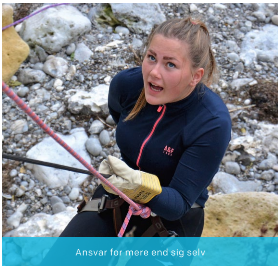
Ansvar for mere end sig selv