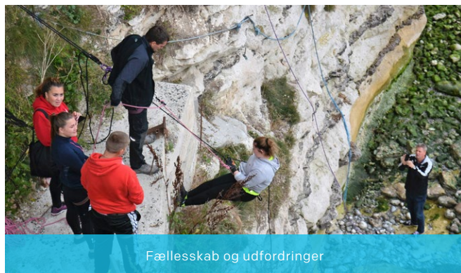
Fællesskab og udfordringer

SSP-samarbejdet er i Stevns Kommune en integreret del af UngStevns.